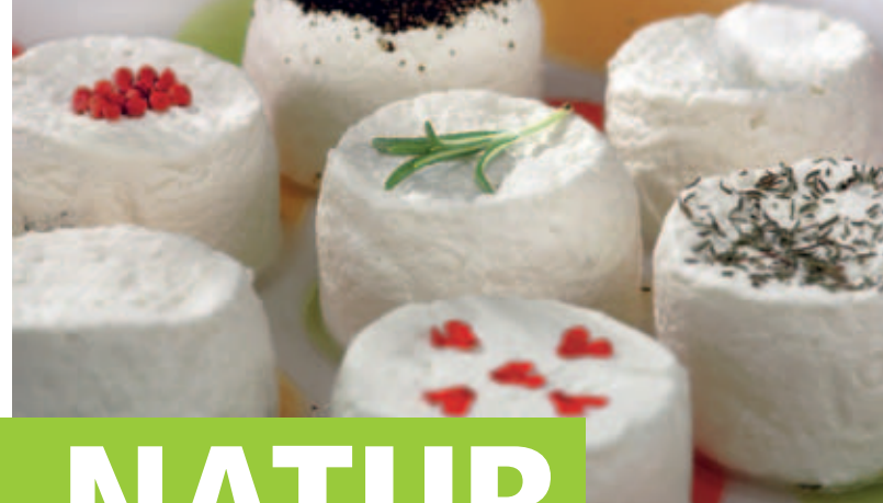
Konzept: RegioContact PR, Kirchzarten Gestaltung: qu-int